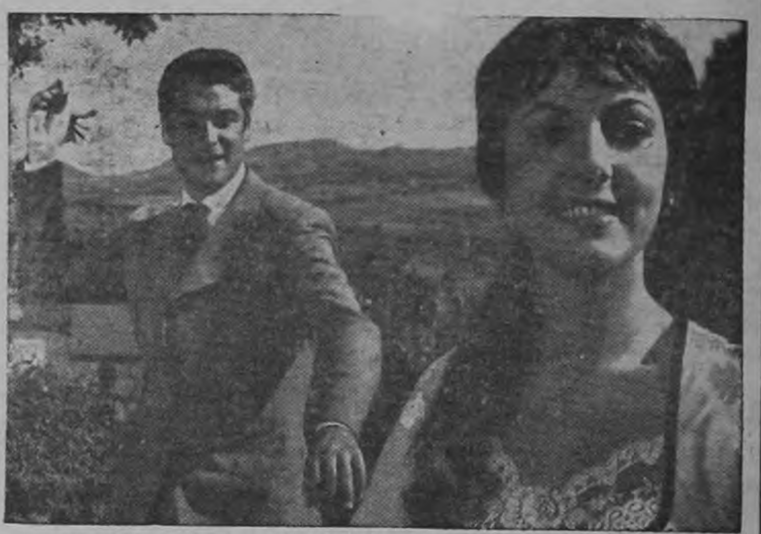
¡ACCION! ¡ROMANCE; Y la belleza de la SEMANA SANTA ANDALUZA!!

¡Premio "OSO DE PLATA" del Festival de BERLIN! ¡Una historia apasionante... tres hombres van a MORIR y la mano de Nuestro Padre Jesús el "Rico" ha de salvar a uno de ellos... ¡ACCION en las minas de hierro! Amor en la serranía... UNA JOYA QUE LLEGA AL CORAZON DE TODOS!!